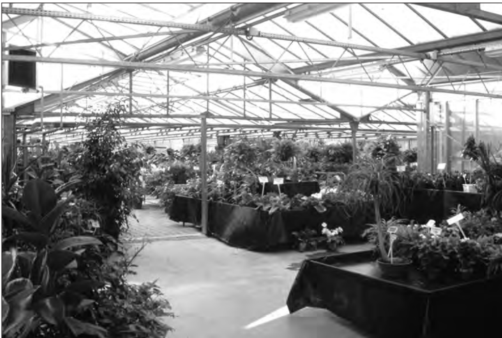
Les serres florales du centre de formation et de promotion horticole d'Ecully (CFPH Ecully)