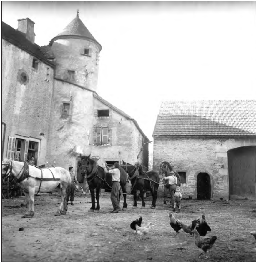
Ministère de l'Agriculture, de l'Alimentation, de la Pêche et des Affaires rurales. Cour de ferme en Côte d'Or.