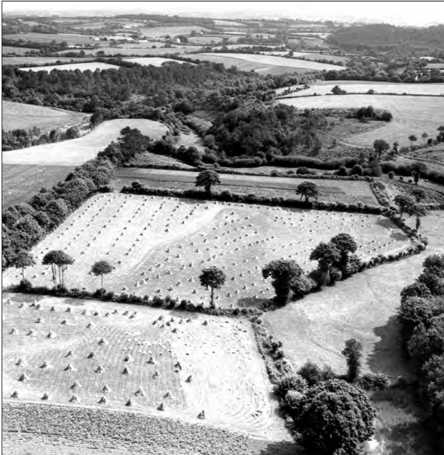
Ministère de l'Agriculture, de l'Alimentation, de la Pêche et des Affaires rurales. 23 229. Paysage breton (Plozevet, 29). 1964.