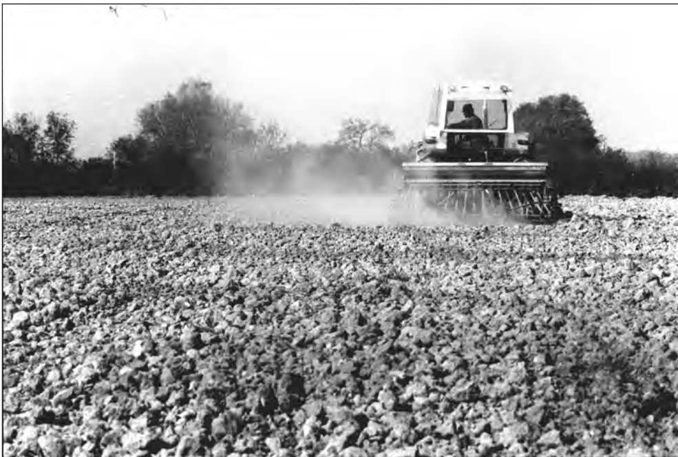
Semis en ligne de blé.